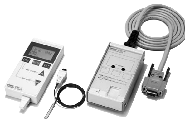
※ 照片为本体+外置传感器+读取器。